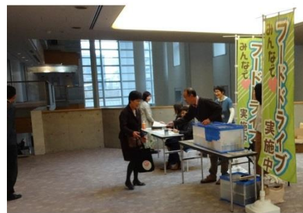
フォーラム前に実施したフードドライブでは、参加者が持ち寄った食料品が集められました。

第二部は、ユニバーサル上映「wonder ワンダー 君は太陽」が行なわれ、約200名の参加者が、ユニバーサルデザインについて学び・楽しむ時間となりました。