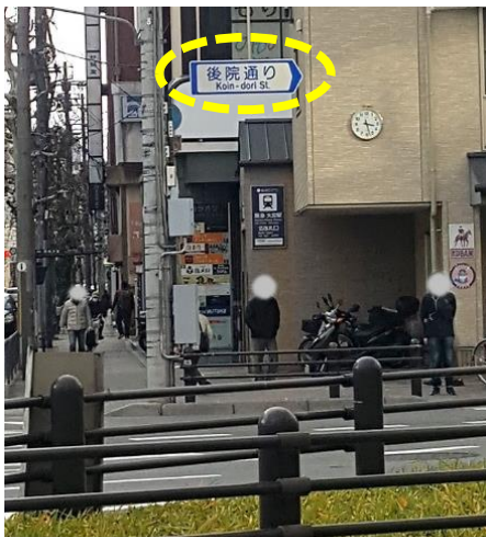
四条大宮交差点の入り口に設置された新しい「後院通り」の看板

「後院通（こういんどおり）」は、千本三条から四条大宮にかけて斜めに走る道路です。立派な名前が付いていますが、「斜めの道」と呼ばれていたり、「千本通」や「大宮通」と勘違いをされていたり、そもそも通り名があることさえ知られていないことが分かり、後院通り近くに活動拠点をもつ（一社）京都映画芸術文化研究所の呼びかけで「後院通」を広く知ってもらうための活動を進めています。