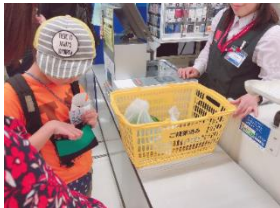
キャッシュレス時代にも対応するために、プリペイドカードへ入金してから食材の買い物に挑戦しました。