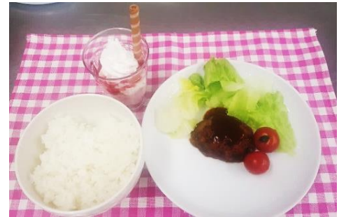
この日のメニューは「煮込みハンバーグ」「パフェ」でした。最初はロコモコ丼の予定だったのですが、参加した子供たちの「ご飯とおかずを別の皿に盛りたい」という意見を取り入れ、とてもおいしい煮込みハンバーグ定食が完成しました。

今後も山科区の青少年活動センターを中心に開催予定ですので、明るく・安心安全な雰囲気の中に進められる場にぜひ参加体験してみてください。