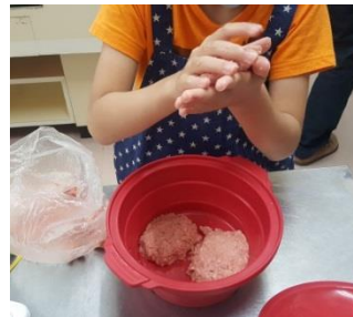
シリコン器具と電子レンジを活用した火を使わない簡単調理なので安心です。子供からは「簡単!家でまた作ろう!」という声も。