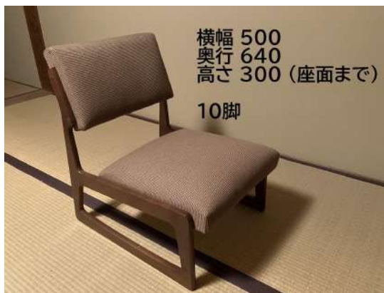
横幅 500 奥行 640 高さ 300 (座面まで) 10脚