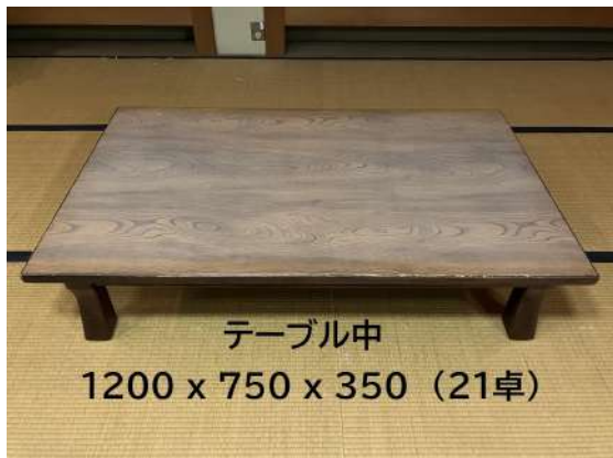
テーブル中 1200 x 750 x 350 (21卓)